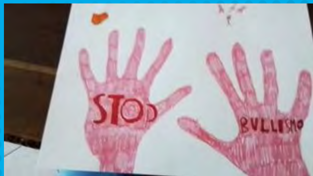
DISEGNO DI DIEGO TASCHINI