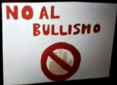
DISEGNO DI DAVIDE MARINI