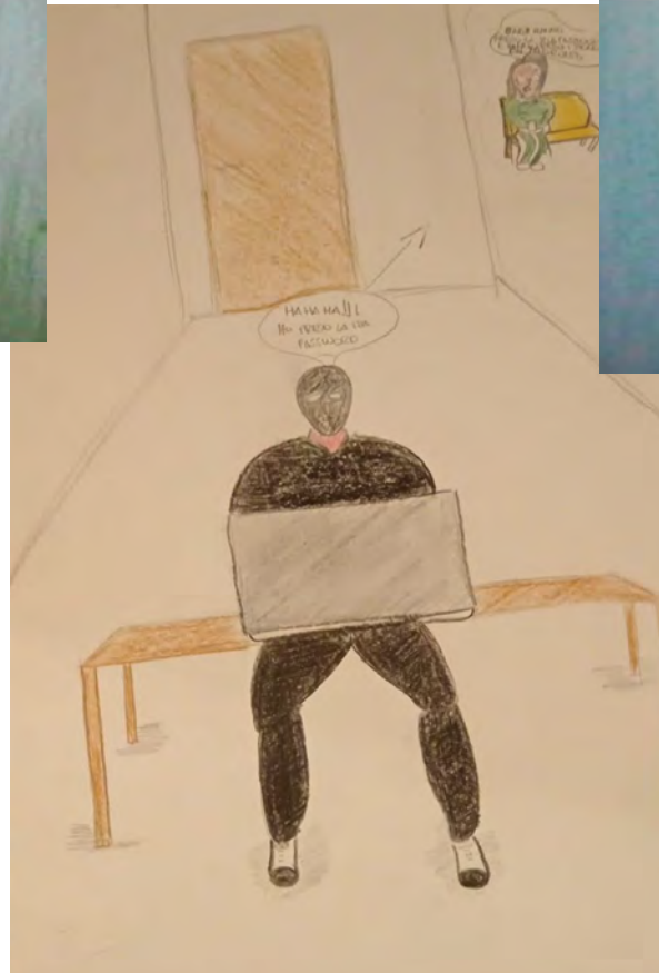
disegno su i cyber crimes