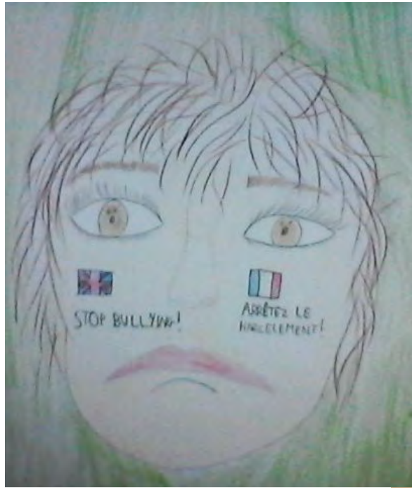
disegno sulle lingue