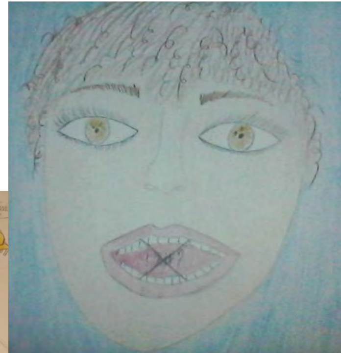
disegno sull'hate speech